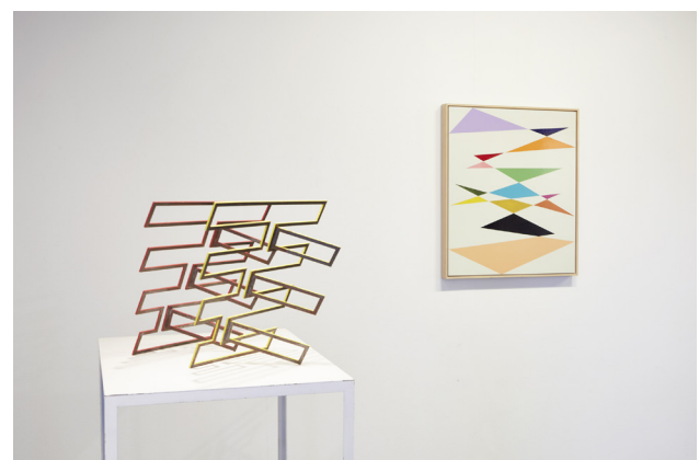
Gillian White, Kleinskulptur und Beat Zoderer, Intersection No. 4_21