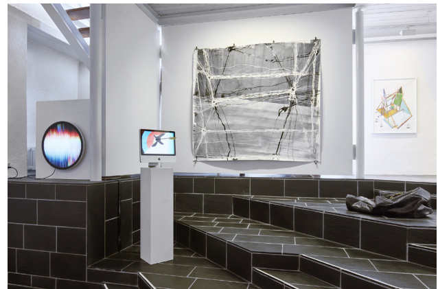
Ausstellungsansicht unteres Geschoss