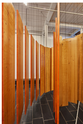
Ausstellungsansicht unteres Geschoss