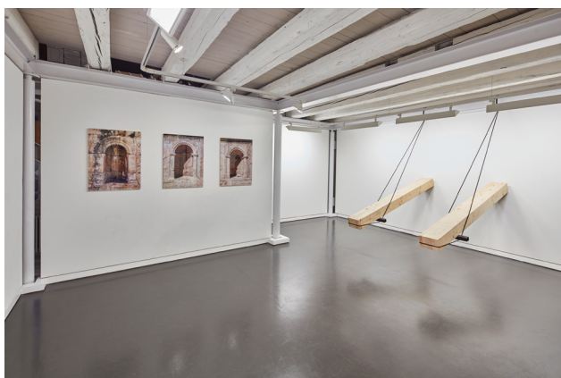
Ausstellungsansicht oberes Geschoss