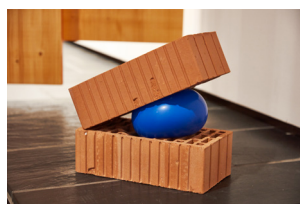
Ausstellungsansicht unteres Geschoss